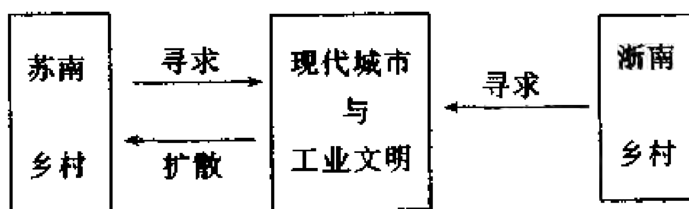
图 6—1 现代城市及工业文明同苏南和浙南乡村的关系

围最大的城市是远不能同上海甚至也不能同苏、锡、常相提并论的城市——温州，小城镇的密集度也大大低于前者。这样一种地理位置上的差异，使得周庄和虹桥两镇，乃至苏南和浙南两地及生活于其间的人民，在近代以来接受以工业文明为主导的现代城市文明时差异颇多。这种差异主要表现在两个方面：其一是程度上的，即自近代以来苏南地区所受的现代城市文明的影响要大于浙南；其二是方式上的，如图 6—1 所示，现代工业文明同苏南乡村是以“扩散—寻求”的互动型模式发生作用的，而它同浙南乡村之间则主要是一种单向的寻求关系。这种区别早